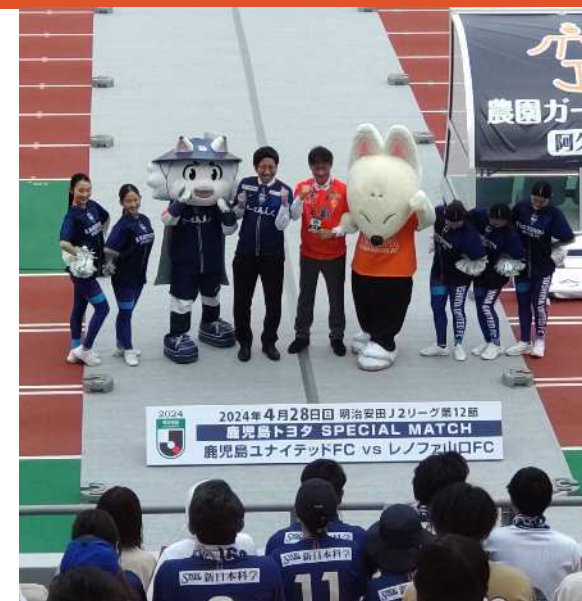
市長招待サッカー試合の対応