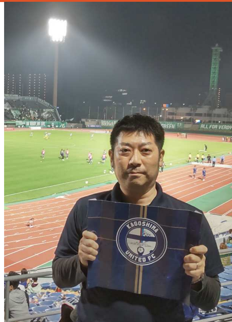
プロサッカー応援の一コマ