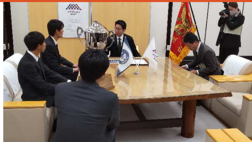
スポーツチーム市長表敬の対応