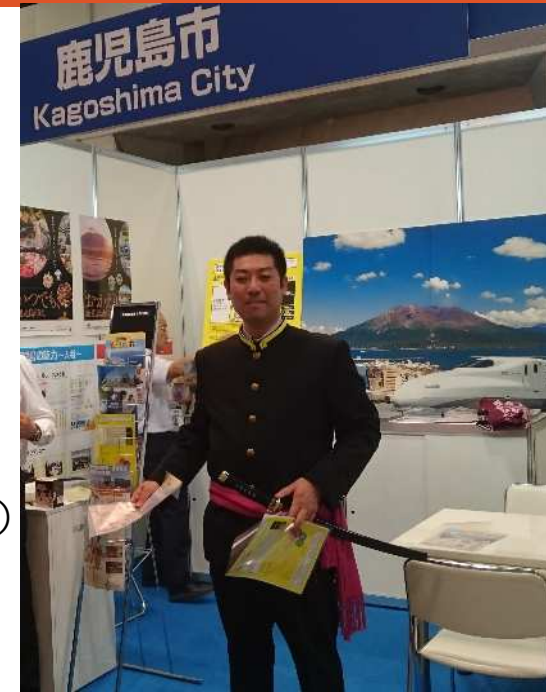
首都圏展示会での企業誘致PR